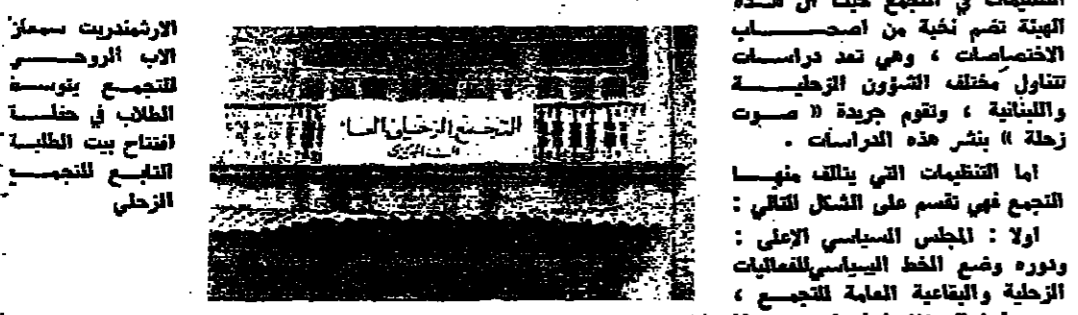
عبد الاحد انتقاب العام في الربيعية الثانية بالارشادية سيمان الرومي للتجمع .

زحلة - من عيد الاشرق : لعيب التجمع الزهلي خلال فترة الاحداث ، دور الدولة في مختلف المراحل . اما الآن وقد عدلت السلطة الى زحلة والبقاع ، كما تم تدشين حاجلة لنشاطات ليست من اخصاصه بدأ التجمع في ابراهيم اعماله على قطاعات مختلفة هي : ١ - الاعلام : يقوم مكتب الاعلام والتوجيه باصدار ونشر جريدة ابراهيمية هي « صوت زحلة » واحياء محاضرات وقائده مع الاطفال للتربية . ٢ - التربية : منظمة الطلاب التي تتكلم من مجلس الطلبة ودائرة العمل الطلابي في زحلة والبقاع - والدراسة الرياضية . ٣ - الاحداث والتخطيط : من اهم التنظيمات للتجمع حيث ان هذه الهيئة تضم نخبة من اصحاب الاختصاصات ، وهي تعد دراسات تتناول مختلف الشؤون التربوية والبيئية ، وتقوم جريدة « صوت زحلة » بنشر هذه الدراسات . اما التفتيات التي يتكلم عنها التجمع فهي تضم على الشكل التالي : اولاً : المجلس السياسي الاعلى : ودوره وضع الخط السياسي للمطالبات والحياة الثقافية العامة للتجمع ، وعدد اعضائه ١٧ شخصاً ، وهذا المجلس سري .